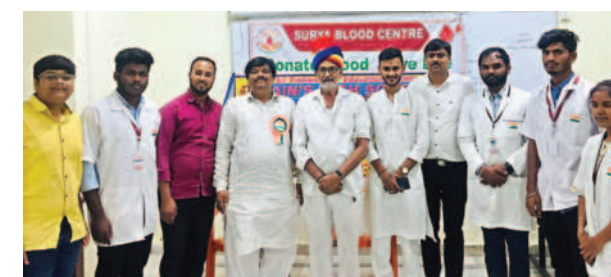
हैदराबाद, 26 जनवरी (स्वतंत्र वार्ता)। जैन हाई स्कूल बेगम बाजार में गणतंत्र दिवस पर अमर शहीदों के नाम रक्त दान शिविर का आयोजन किया गया।