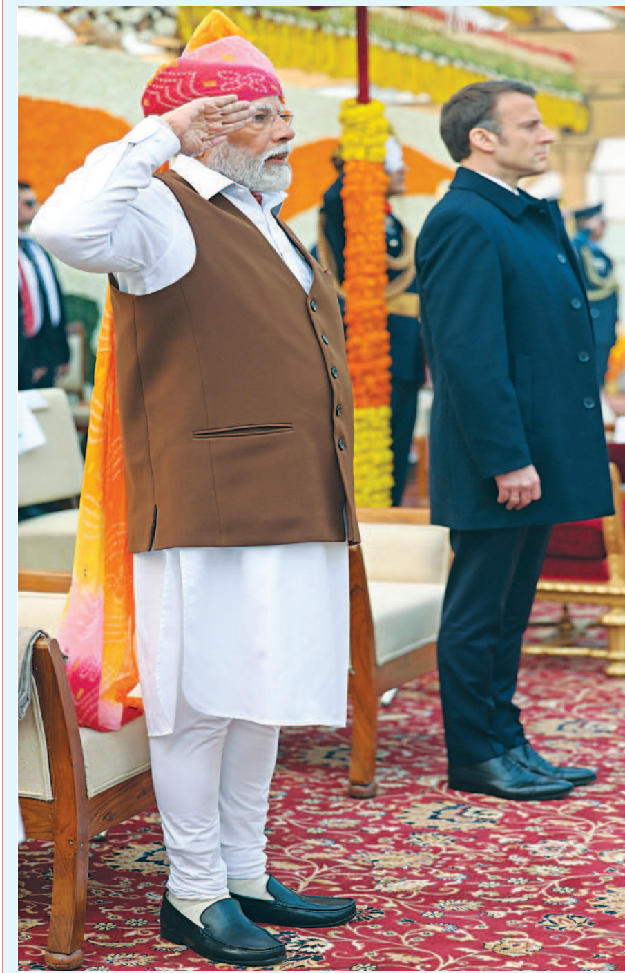
फ्रांस के राष्ट्रपति इमैनुएल मैक्रों के परेड की सलामी लेते प्रधानमंत्री नरेंद्र मोदी।